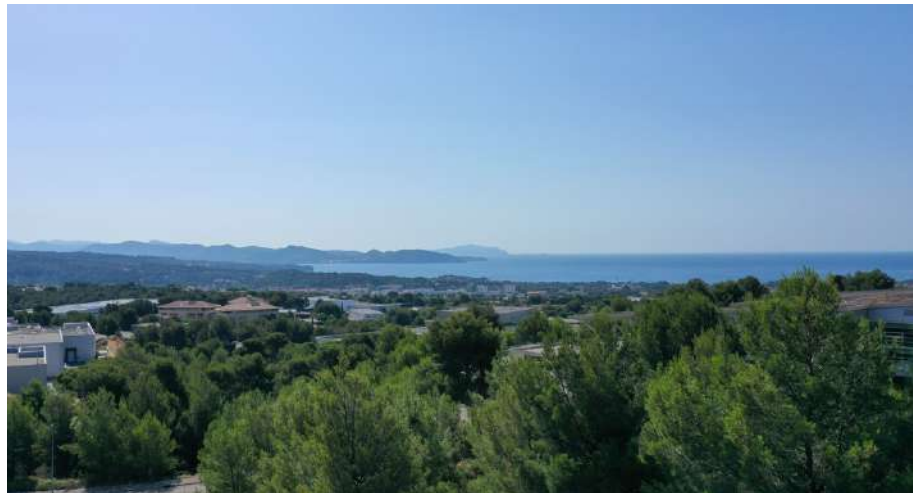
Vue depuis RoofTop Stone One

L'ensemble des vues sud/sud-est sont tournées vers la mer afin d'offrir des perspectives lointaines depuis l'intérieur du bâtiment.