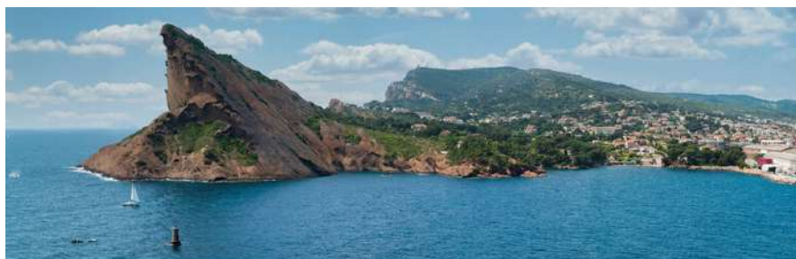
Bec de l'Aigle