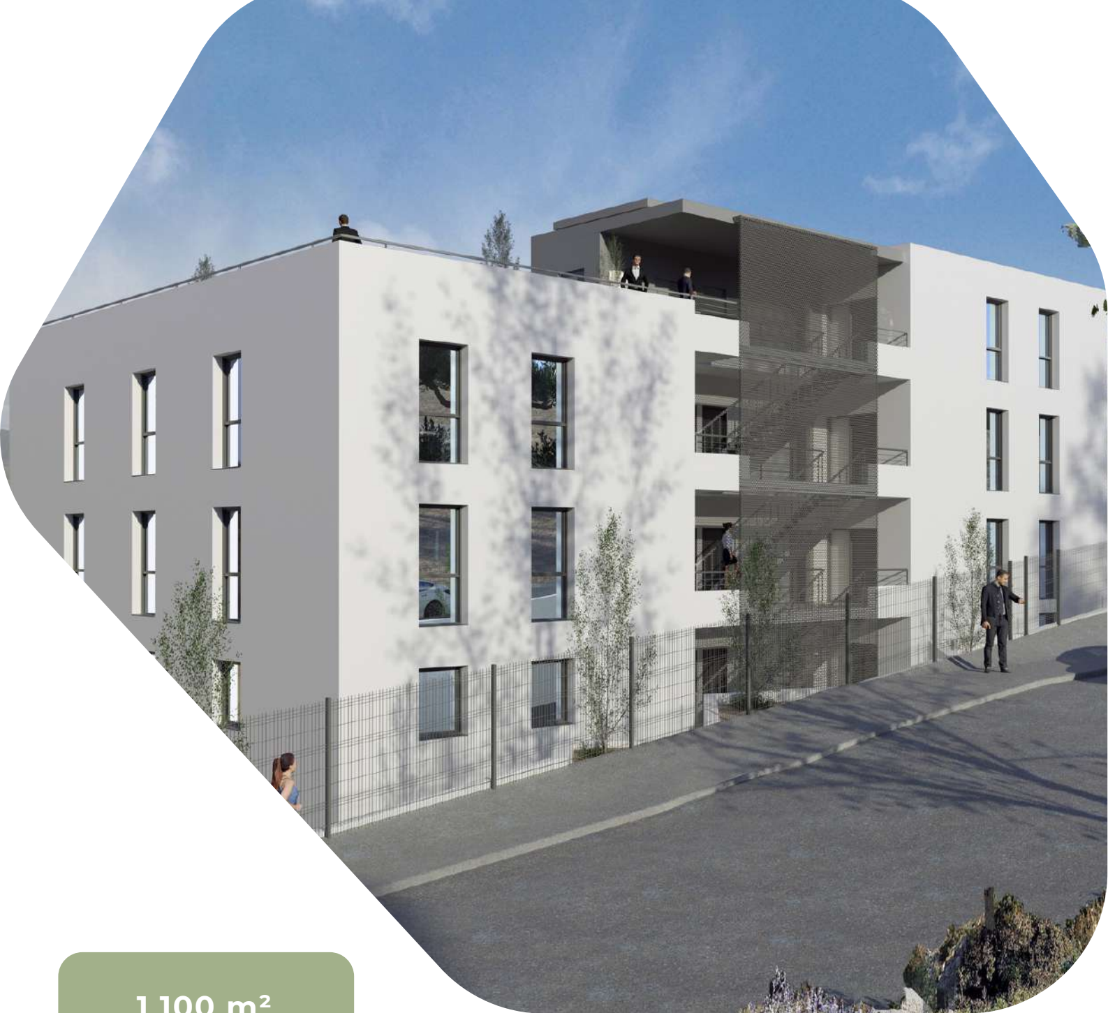
Illustration du projet