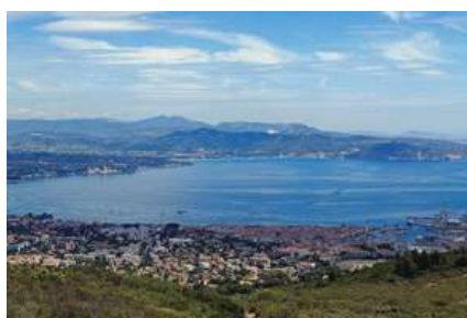
Baie de La Ciotat